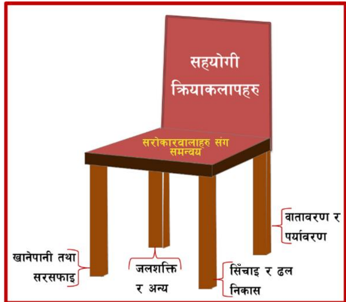
चित्र नं. १ जलस्रोत व्यवस्थापन कुर्सी

जलशक्ति र अन्य : परम्परागत तथा सुधारिएको पानीघट्ट, साना जलविद्युत् उत्पादन आदि । पानीमिल, सुधारिएको घट्ट घरेलु उद्योगका लागि पानी, लघु जलविद्युत् योजना, माछा पोखरी, जनावरका लागि पानी धार्मिक प्रयोजन एवम् जलक्रिडास्थल लागि पानी आदि ।